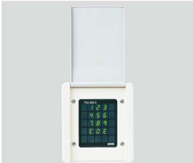
写真はTKU-002・D型 WH色 (操作器)

型 ■用途:住宅/マンション/寮/ビル/病院等 ■納期:標準納期品●(P3参照) 制御器は屋内仕様