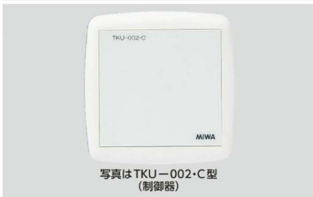
写真はTKU-002・C型 (制御器)