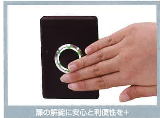
扉の解錠に安心と利便性を+

直接接触らない・安心感 手を近づけるだけで解錠できる、 電気錠解錠用 非接触型解錠スイッチです。